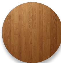
PISOS DE MADEIRA